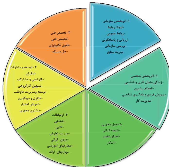
شکل ۱. مدل شایستگی‌های مدیریت استون، ۲۰۰۱

همانچه که پیش از این نیز بدان اشاره شده است، یکی از منابع مهم مورد استفاده در این پژوهش، نتایج احصاء شده از مصاحبه‌های تخصصی با مدیران عالی صنعت نفت می‌باشد که تحت عنوان « ذهن کاوی مدیران صنعت نفت » در تدوین سند راهبردی توسعه منابع انسانی در صنعت نفت نیز از آن بعنوان یکی از منابع داخلی مهم و اصلی استفاده شده است و رویکرد دوم در جمع‌آوری نظرات مدیران و خبرگان صنعت نفت به نتایج این طرح متکی است.