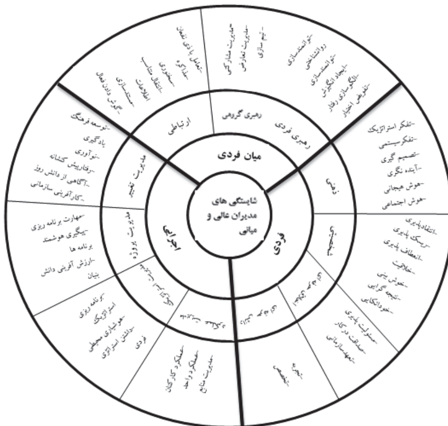
شکل ۱- مدل شایستگی مدیران عالی و میانی شرکت ملی صنایع پتروشیمی ایران

داده‌های حاصل از مصاحبه عمیق و نیمه ساختاریافته به روش تحلیل تماتیک، مورد تحلیل قرار گرفته و مدل اولیه پژوهش مشخص شد. در ادامه با مطالعه اسناد بالادستی شرکت ملی صنایع پتروشیمی ایران و مبانی نظری و پیشینه پژوهش مدل نهایی شایستگی مدیران عالی و میانی شرکت ملی صنایع پتروشیمی ایران طراحی شد که با استفاده از روش دلفی مورد آزمون روایی قرار گرفت. مدل شایستگی طراحی شده شامل ۳ بعد، ۱۰ مؤلفه و ۴۶ شاخص می‌باشد که در شکل (۱) نشان داده شده است.