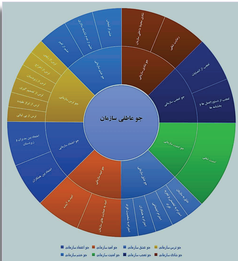
نمودار ۲- ابعاد جو عاطفی سازمان (منبع: یافته‌های تحقیق)

برای سازمان در پی داشته باشد. بروز خشم بیش از حد در سطح سازمان باعث به وجود آمدن جوّی مضر در سازمان و کاهش رضایت شغلی، خشونت و بی حرمتی می‌شود (Gibson, Schweiter, & Callister, 2009).