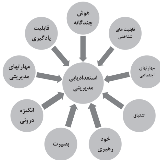
شکل ۲- مدل مفهومی استعدادیابی مدیریتی در صنعت نفت (یافته‌های پژوهشگران)

در نهایت، با استفاده از نتایج سه راند دلفی و استخراج مؤلفه‌های مؤثر بر استعدادیابی مدیران، مدل مفهومی تحقیق مطابق با شکل (۲) ارائه می‌گردد.