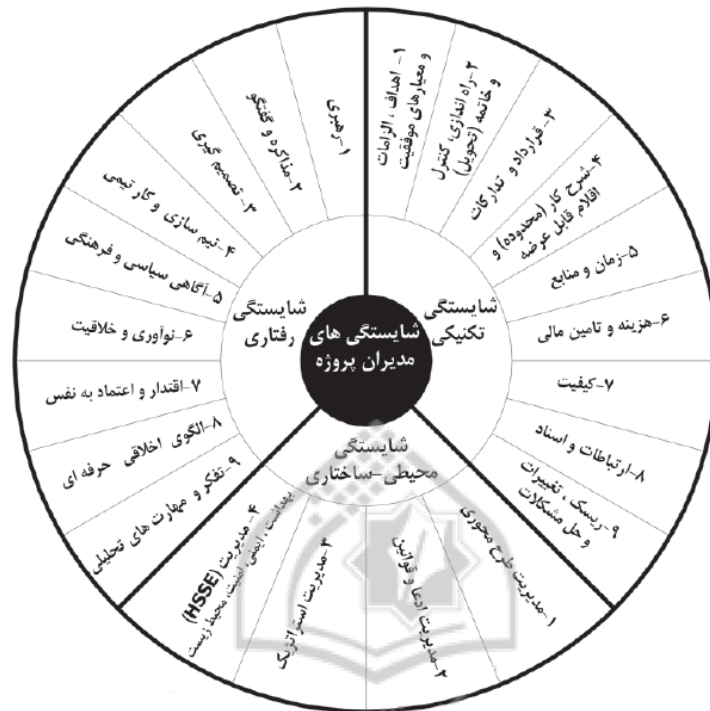
تصویر ۱. مدل گرافیکی شایستگی‌های مدیران پروژه POGC