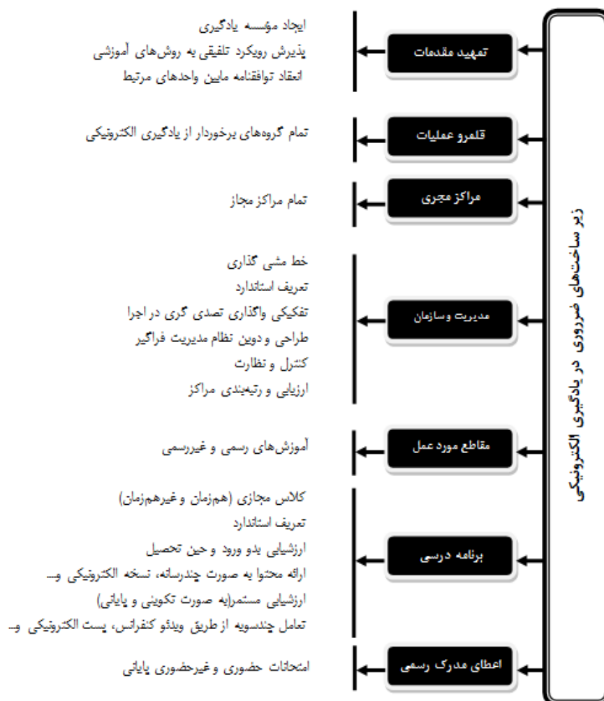
شکل ۱. محورها و زیر محورهای ضروری برای اجرای یادگیری الکترونیکی (الحسینی، ۱۳۸۲)

رزنبرگ یادگیری الکترونیکی را ملزم به داشتن زیرساخت‌های فراوانی می‌داند که در زیر مهم‌ترین آن‌ها آمده است: