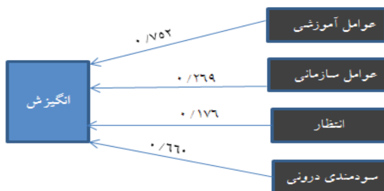
شکل ۴. مدل تجربی تحقیق

به سایرمتغیرها بتای بزرگتری دارد (۰/۷۵۲) قوی ترین پیش بین برای انگیزش کارکنان جهت شرکت در دوره های آموزشی ضمن خدمت می باشد. بنا براین با توجه به جداول (۶) و (۷) و آزمون فرضیه ها مدل تجربی مطابق شکل (۴) می باشد.