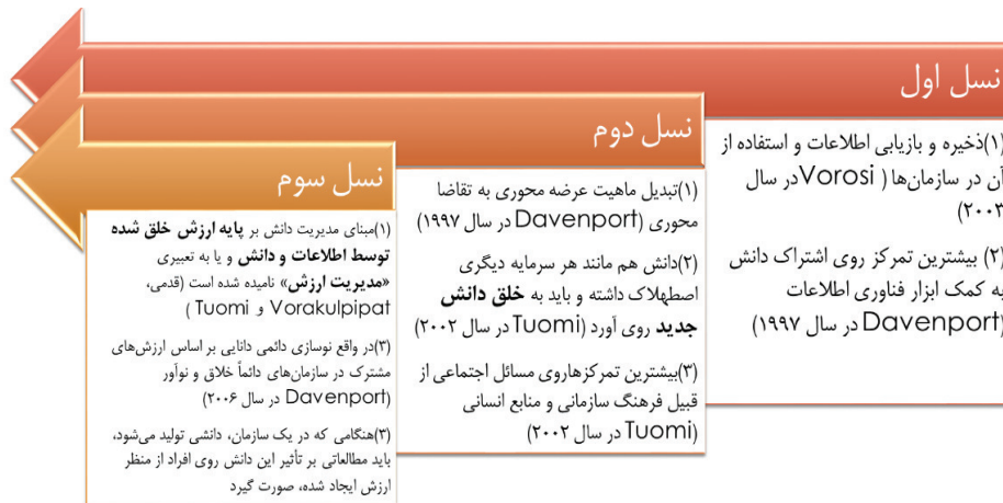
شکل ۱. سیر تکامل نسل‌های مدیریت دانش و شیوه تمرکز آنان روی مسائل دانشی

سه نسل موجود در شکل ۱، بصورت ممتد و موازی تصویر شده است؛ زیرا که در بعضی از سازمان‌های امروزی، همچنان رویکردها و توجهات سنتی در پیاده سازی مدیریت دانش (نسل اول و دوم) وجود دارد. همانطور که مشاهده می‌شود، آینده مدیریت دانش با نسل سوم آن گره خورده و رویکردهای مشابهی را همسان "مدیریت ارزش" (یا مدیریت فرایندهای «ایجاد ارزش از دانش ذخیره و به اشتراک گذاری شده» با منابع موجود) به خود گرفته است. جالب اینجاست که در سال ۱۹۹۸ محققى به نام تیس ۱ نیز به این موضوع واقف بوده و انتهای فرایند مدیریت دانش خود را با اندازه‌گیری ارزش سرمایه دانشی (تأثیر مدیریت دانش) به پایان می‌رساند (Teece, 1998). با هدف اکتساب مهم‌ترین نقاط متمایز آینده مدیریت دانش (مدیریت ارزش)، مشخصه‌هایی شامل توسعه مشارکت‌های اجتماعی فعال به جای انفعال در سازمان، آموزش سازمانی، جنبه‌های اجتماعی- فرهنگی سازمانی با تأکید بر شبکه‌های انسانی، ساختار نوآوری، مدیریت تغییر، سرمایه‌های فناوری و سرمایه فکری تفوق یافته‌اند که از مقالات پایه تحقیق استخراج شده و نهایتاً منجر به طراحی سؤالات پرسش‌نامه شده است.