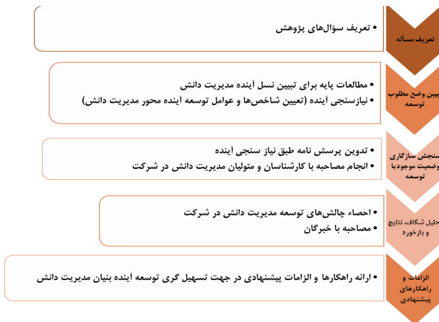
شکل ۲. گام‌های پژوهشی پیموده شده توسط محققین