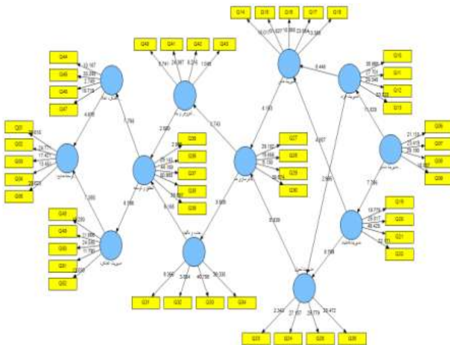
شکل ۱. اعتبارسنجی مدل توسعه منابع انسانی در شرکت‌های دانش‌بنیان با رویکرد قابلیت‌های بلوغ کارکنان (تخمین استاندارد)

پس از ارائه مدل توسعه منابع انسانی در شرکت‌های دانش‌بنیان با رویکرد قابلیت‌های بلوغ کارکنان، جهت اعتبارسنجی از روش حداقل مربعات جزئی (PLS) استفاده شد. مدل ساختاری نهایی پژوهش در شکل ۱ نمایش داده شده است. در این مدل که خروجی نرم‌افزار Smart PLS است خلاصه نتایج مدل در حالت تخمین