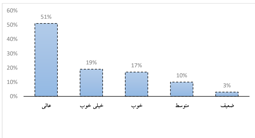
شکل ۱. ارزیابی کیفیت مقالات گزینش‌شده بر اساس چک‌لیست CASP

جهت ارزیابی کیفیت مقالات انتخاب‌شده، از برنامه مهارت‌های ارزیابی حیاتی (CASP) استفاده شده است. بر اساس ۱۰ معیار معرفی شده در وبسایت CASP، ( http://casp-uk.net/casp-tools-checklists )، نسبت به ارزیابی کمی کیفیت مقالات اقدام شد. نتایج حاصل از ارزیابی کیفی مقالات با استفاده از چک‌لیست CASP در شکل ۱ نشان داده شده است.