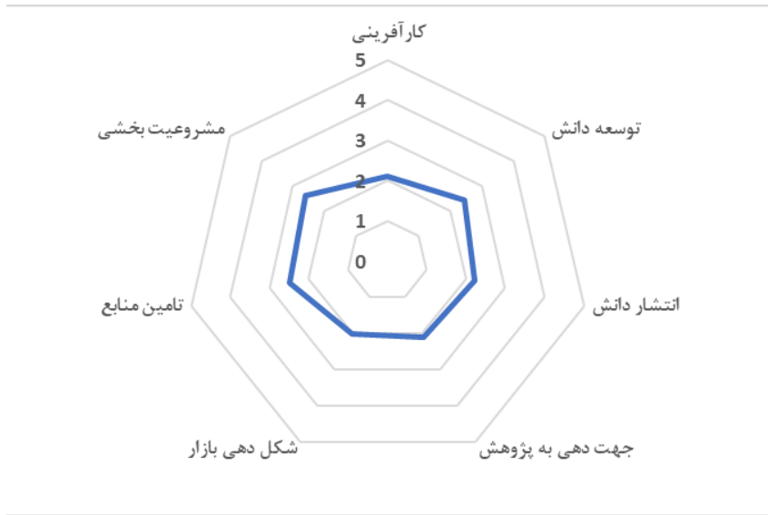
شکل ۲. وضعیت کمی کارکردهای نظام نوآوری فناورانه صنعت نفت ایران (حاصل از پیمایش)

شکل ۳ مؤلفه‌های زیرمجموعه کارکردهای نظام را به صورت نمودار میله‌ای نمایش می‌دهد که مقایسه آنها را با یکدیگر تسهیل می‌کند. این شکل نشان می‌دهد که مؤلفه‌های ضعیف مسبب شکست در نظام، به تفکیک هر کارکرد، کدام‌اند و نیز چه مؤلفه‌های کارکردی موجب تقویت نظام می‌شوند. برای تحلیل علت ضعف و قوت‌های کارکردی نظام، باید به تعامل ساختار و کارکردها توجه کرد. در ادامه با استناد به مصاحبه‌های انجام‌شده و بررسی اسناد و سوابق موجود، به اجمال تحلیلی پیرامون نقاط ضعف هر کارکرد ارائه شده است.