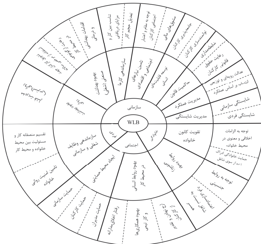
شکل ۱- الگوی بصری تحقیق برگرفته از انجام مصاحبه

با توجه به تحلیل داده‌های حاصل از انجام مصاحبه، الگوی تعادل کار-زندگی در شرکت مورد مطالعه به چهار طبقه یا سازه اصلی شامل: سازمانی، اجتماعی، فردی و خانوادگی تقسیم می‌شود. الگوی بصری تحقیق طبق شکل (۱) که در واقع، همان الگوی کدگذاری محوری است، توسط مدیران ارشد شرکت گاز استان مازندران طبق جدول (۷) مورد تأیید قرار گرفت.