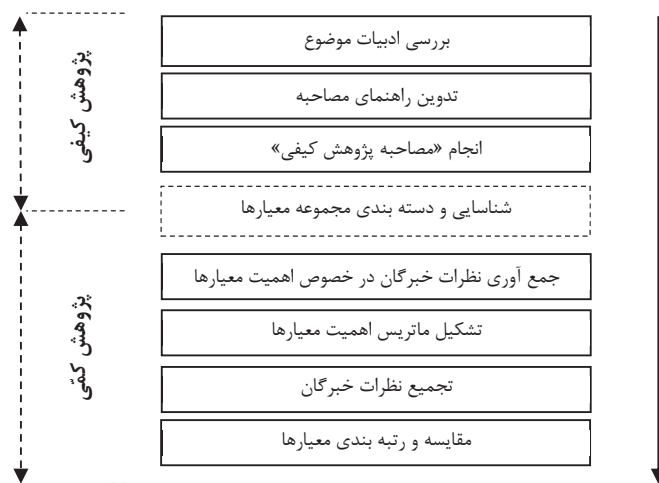
شکل ۱. مراحل انجام پژوهش

همان گونه که در بخش ۴ بیان شد برای دستیابی به اهداف پژوهش، روش آمیخته اکتشافی به عنوان روش پژوهش مورد استفاده قرار گرفته است. یکی از ویژگی‌های پژوهش آمیخته، توالی استفاده از روش‌های پژوهش کمی و کیفی است (بازرگان، ۱۳۸۷). در اجرای این پژوهش مطابق شکل ۱، از توالی کیفی - کمی روش‌ها استفاده شده است. به عبارت بهتر ابتدا ادبیات موضوع مورد بررسی قرار گرفته است. با توجه به این که در خصوص معیارهای انتخاب کارکنان برای اعطای تسهیلات مسکن پژوهش جامعی یافت نشد، درک بهتر موضوع و بررسی و شناسایی همه جانبه معیارهای موثر در اعطای تسهیلات مسکن در صنعت نفت انجام پژوهشی کیفی را ایجاب نموده است. یکی از مواردی که در آن انجام «مصاحبه پژوهش کیفی» مناسبیت دارد جایی است که پیش از انجام یک پژوهش یا بررسی کمی، یک بررسی اکتشافی ضروری است (دانایی فرد و دیگران، ۱۳۸۶). پس از تحلیل و دسته بندی معیارهای شناسایی شده، به منظور تعیین میزان اهمیت و رتبه بندی معیارهای اعطای تسهیلات مسکن از روش کمی (که در بخش ۴-۳ تشریح می‌گردد) در این پژوهش استفاده شده است.