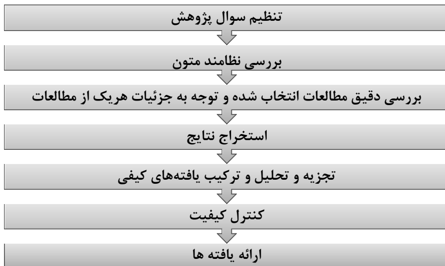
شکل ۱- گام‌های روش فراترکیب

این پژوهش با روش کیفی فراترکیب ۱ انجام شد. این روش برای ترکیب مطالعات کیفی مرتبط با یک پدیده و توصیف و تفسیر آن‌ها به کار می‌رود (Whittemore, 2005). فراترکیب، پژوهشی است که به ارزشیابی پژوهش‌های دیگر می‌پردازد. به عبارتی، مرور یکپارچه منابع یا مرور سامانمند نیست؛ هدف اصلی فراترکیب ساخت نظریه، حمایت از تئوری‌های موجود و تفسیر و روشن‌سازی و تکمیل آن‌ها است (Sandelowski & Barsoo, 2007). در حقیقت دیدگاه تفسیری فراترکیب عامل افتراق آن با فراتحلیل است. این رویکرد، روشی نوین برای گردهم آوردن، مقایسه و ترجمه مطالعات کیفی با یکدیگر است. در پژوهش‌های سازمانی از روش فراترکیب کمتر استفاده شده است. نمونه موردنظر در این پژوهش، از مطالعات کیفی منتخب و بر اساس ارتباط آن‌ها با سؤال پژوهش ساخته می‌شود. این پژوهش در دو مرحله انجام شد. درنهایت با توجه به انجام مراحل روش فراترکیب و همچنین تحلیل اسناد مرتبط و اخذ نظر خبرگان جهت بهینه‌سازی آموزش‌های سازمانی صنعت پتروشیمی، الگوی انطباقی ارائه گردید. در ادامه گام‌های روش فراترکیب با ابتناء بر روش ساندلوسکی و بارسو ۲ (۲۰۰۷) مطابق شکل شماره ۱ تشریح شده است.