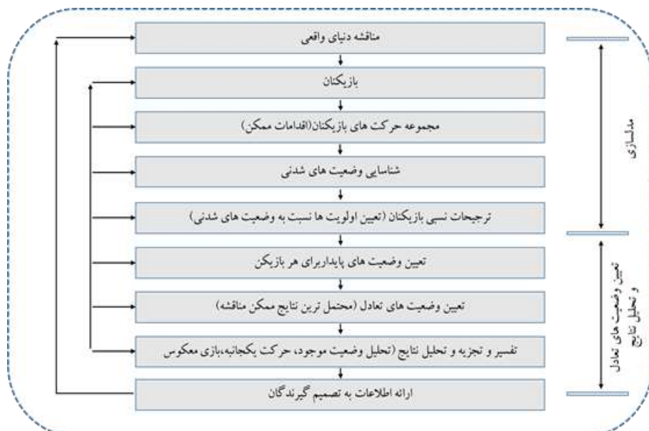
شکل ۱. فرایند مدل‌سازی و تجزیه و تحلیل در مدل‌های گراف

تعادل میان بازیگران در حوزه سرمایه‌گذاری و تأمین مالی صنعت پتروشیمی ایران، به دلیل ماهیت پیچیده و چندوجهی آن، نیازمند رویکردهای تحلیلی ساختاریافته است. مدل گراف در نظریه بازی‌ها، به‌عنوان ابزاری کارآمد در تحلیل تعارضات چند بازیگری، به‌ویژه در شرایطی که ترجیحات بازیگران قابل‌اندازه‌گیری دقیق نیست، مورد استفاده قرار می‌گیرد (Fang et al., 2003; Rosenhead & Mingers, 1989; Wang et al., 2018; Kilgour & Hipel, 2010).